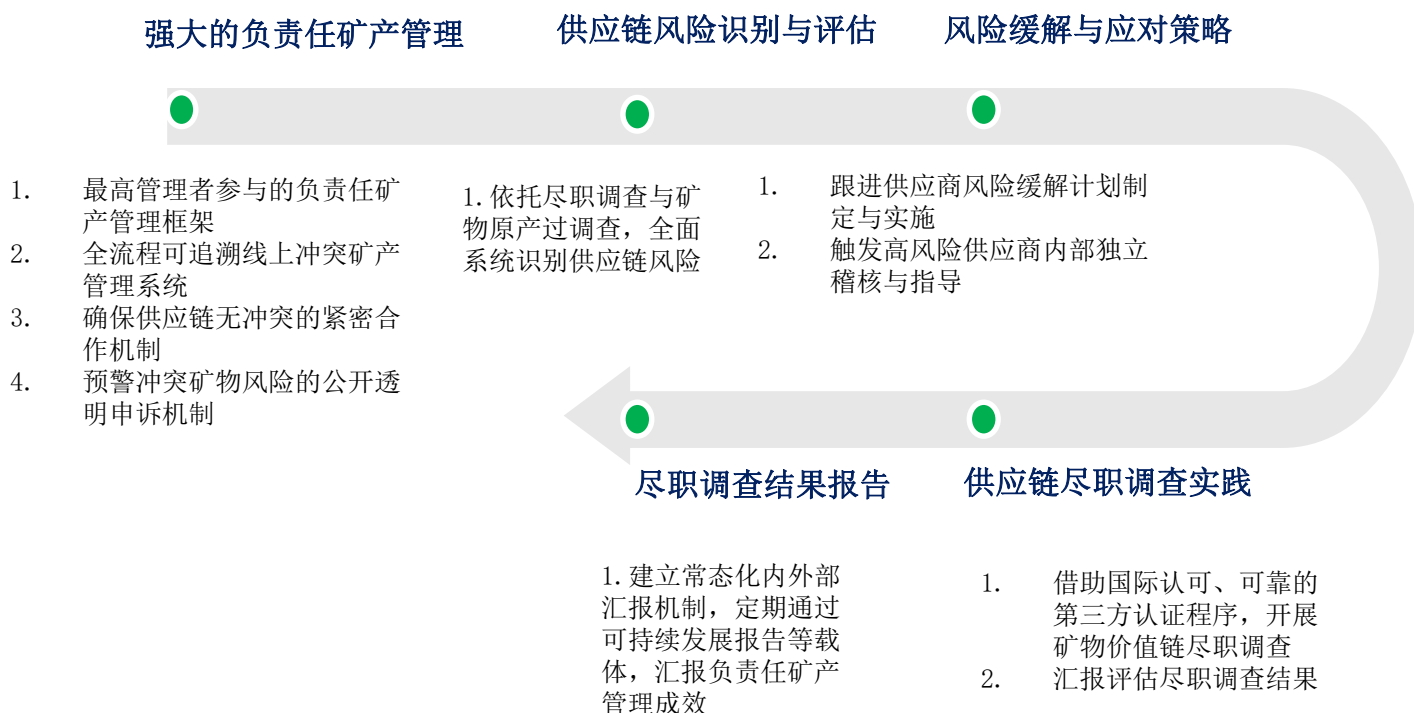
图注：立景负责任矿产管理规划

立景的负责任矿物管理程序，以确保矿物价值链可追溯、无冲突为目的，策划开展尽职调查与合理原厂国追溯（RCOI）。我们参照经济合作与发展组织（OECD）指南框架，对负责任矿物管理程序进行详尽的策划和实施。